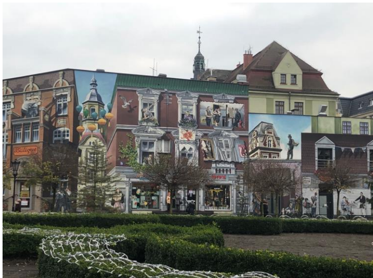
Mural przy ul. Starzyńskiego