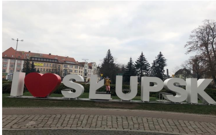
Napis I love Słupsk